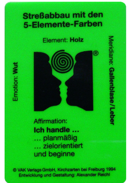
Abb. 1: Beispiel einer Farbkarte vom Element Holz mit Emotion und Affirmation

Hindernisse auf der sozialen Ebene können entstehen, wenn z. B. ein Patient auf Rentenansprüche oder auf die Auszahlung von Unfallversicherungen wartet. Auch wenn ihm dies bewusst ist, kann das Unterbewusstsein u. U. den Heilungsprozess blockieren, aus Angst, sonst leer auszugehen. Jeder Behandler im medizinischen Bereich kennt diese Problematik. Auch hier gibt das neue kinesiologische System dem Klienten konkrete Hilfestellung. Die ausschlaggebenden Emotionen können nicht nur in den Muskeln festgehalten, sondern über den ganzen Körper hinweg verteilt gespeichert sein.